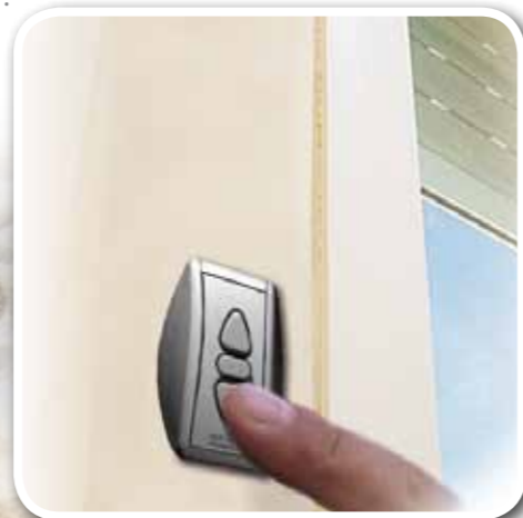
Commande individuelle filaire

L'axe motorisé FIDJI recoupable et adaptable à tout type de volet roulant permet à votre installateur FLG de réaliser un montage simple, rapide et dans les meilleurs délais.